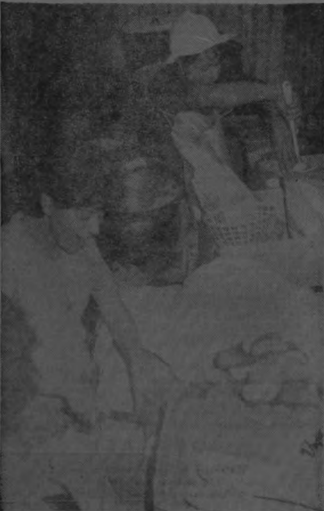
Jóvenes voluntarias del grupo se encargan de preparar el bien ganado alimento.