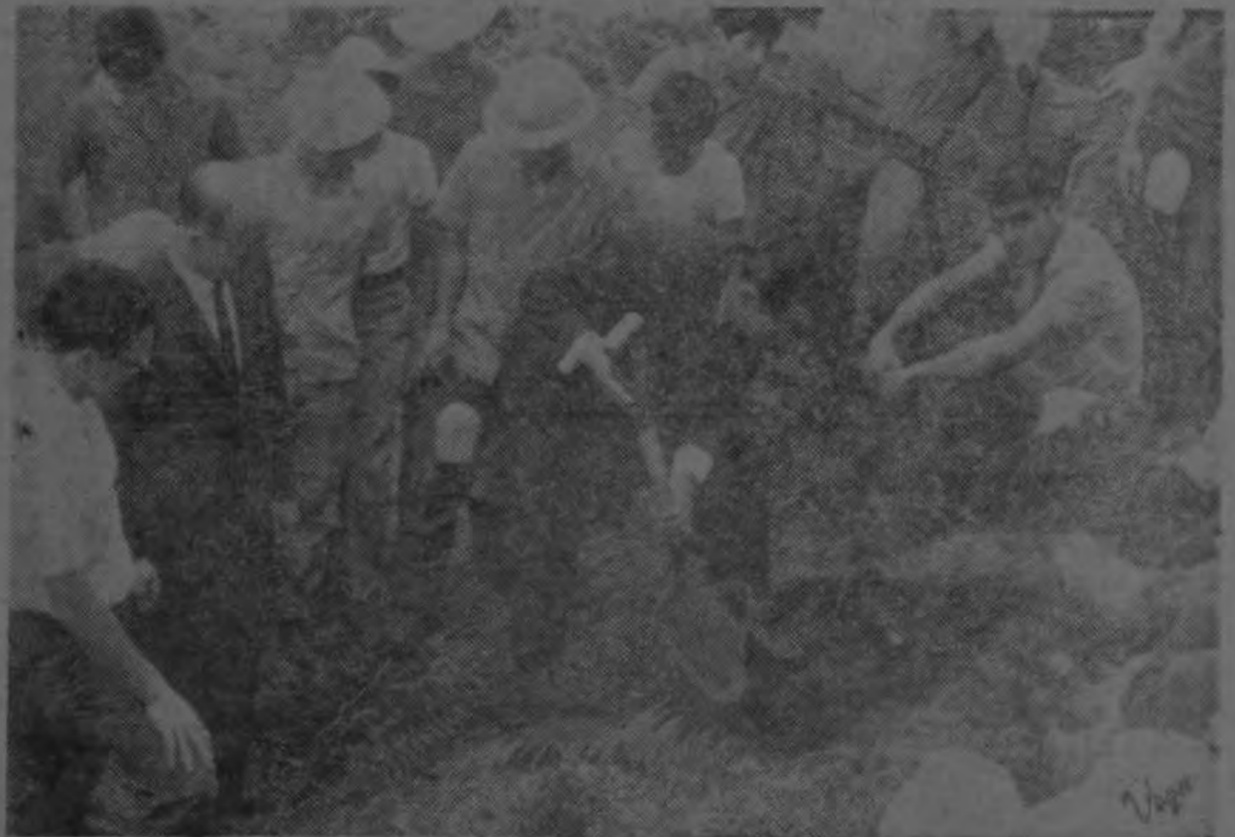
El Ministro de Seguridad Pública, señor Diegobólico acto de solidaridad con este Movimiento. El Trejos siembra un pino eliote como sim-