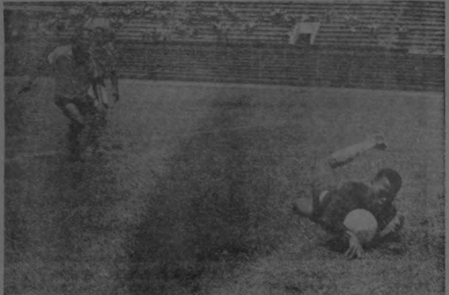
En la segunda etapa del partido entre Uruguay y Limón el arquero visitante tuvo bastante trabajo. El acoso de los lisdreños fue constante, principalmente al terminar el partido. Y fue ca-

LIMÓN: Colle; Mulling, Brown y Dixon; Reid y Crawford; Herrera, Sandí; Quesada; Gutiérrez y Wanchope.