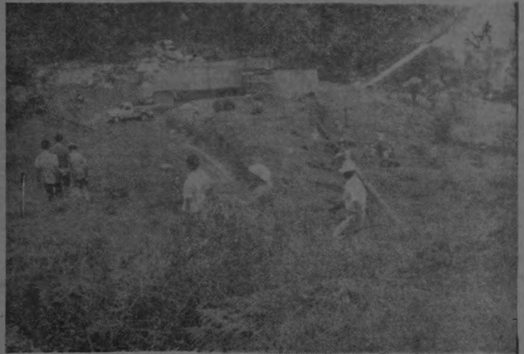
Un nuevo día, una nueva esperanza, y un firme propósito de estos jóvenes de cooperar con la patria dando significación a sus vidas.