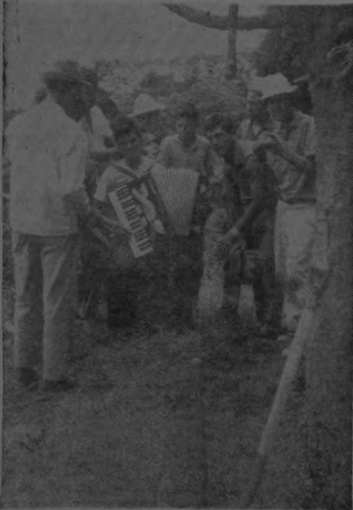
Momento de descanso. sana camaradería, un compañero toca piano, acordeón, otro tamboril. (palas, picas, machetes, vasos) adquieren maravillosas resonancias cuando se quiere pasar un rato agradable alegrando a los otros compañeros que comparten la jornada.

SERVICIO DE CAPILLAS. Teléfono: 21-16-52.